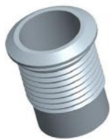
304不锈钢外壳 304 non-enbr oi der ed steel shel l