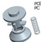
PC键 PC key